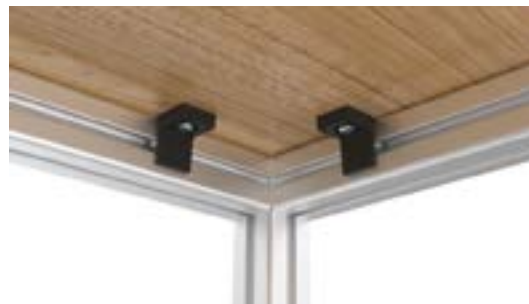
Top Angle Clamp I 40, Slot 8 (Set) Platten-Klemmwinkel I 40, Nut 8 (Set)