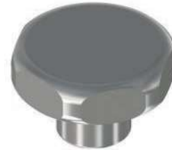
VOLANTINI INOX A LOBI - FILETTO FEMMINA STAINLESS STEEL KNOBS - FEMALE