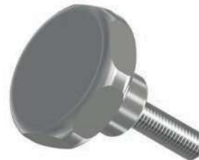
VOLANTINI INOX A LOBI - FILETTO MASCHIO STAINLESS STEEL KNOBS - MALE