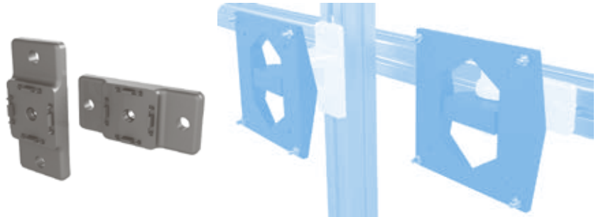
Adapterplatte 40 höhenverstellbar Adapter Plate 40 Height Adjustable