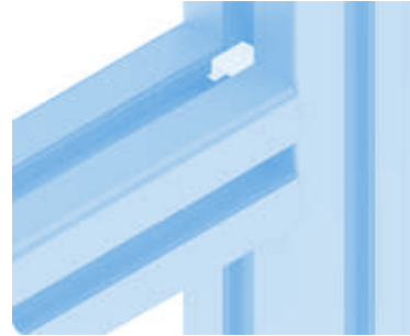
Schraubenverbinder Screw Connector