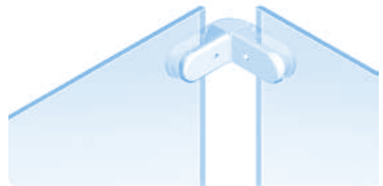
Eckverbinder für Glasscheibenhalter Corner Connection for Glass Panel Clamp