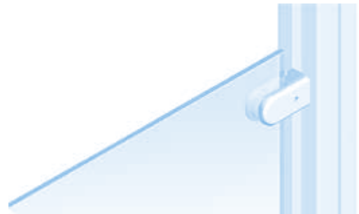
Glasscheibehalter Glass Panel Clamp