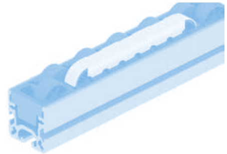
Bremse H26 Brake H26