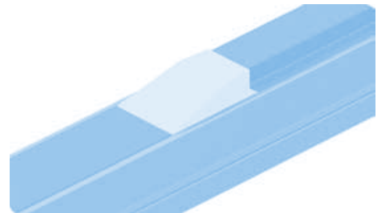
Gleitrampe AL Transition Ramp AL