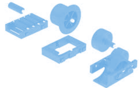
Achse für Rollenschienen AL Axle for roller tracks AL