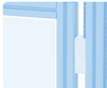
Set Hubtür-Führung Set Lift Door Guide