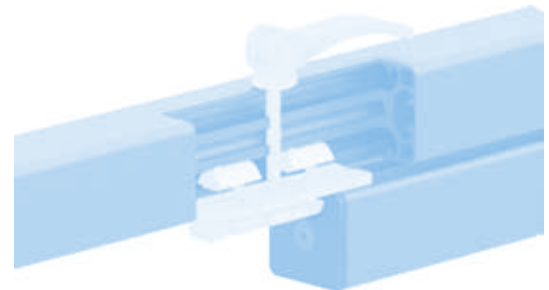
Profilgleiter ZN 40 × 80 (Set) Profile Slider ZN 40 × 80 (Set)