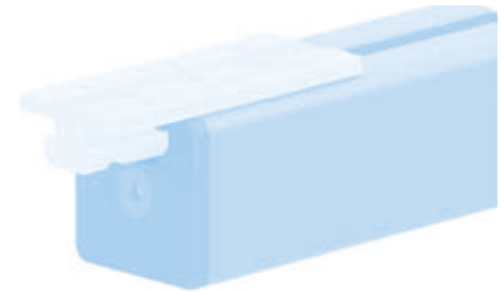
Profilgleiter ZN 40 × 80 (Set) Profile Slider ZN 40 × 80 (Set)