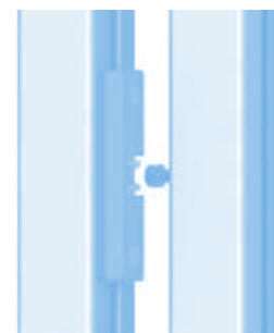
Türschnäpper (Set) Door Latch (Set)