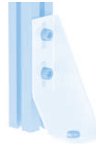
Bodenwinkel 160 Floor Bracket 160