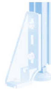
Bodenwinkel 45 Floor Bracket 45