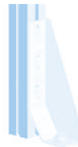
Bodenwinkel 200 Floor Bracket 200