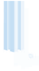
Bodenwinkel 120, höhenverstellbar Adjustable Floor Bracket 120