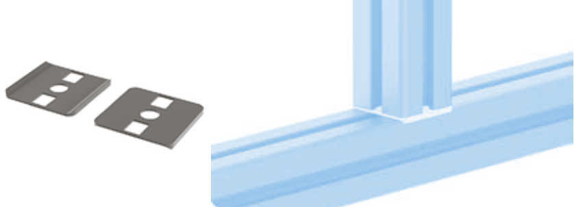
Radiendichtung 40 × 40 Radius Seal 40 × 40