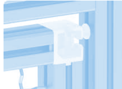
Klemmprofilverbinder 40 (Set) Clamp Profile Connector 40 (Set)