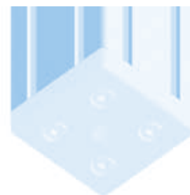
Transport- und Fußplatte 60 × 60 Transport and Base Plate 60 × 60