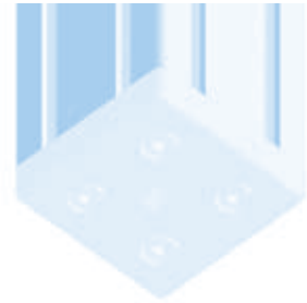
Transport- und Fußplatte 80 × 80 Transport and Base Plate 80 × 80