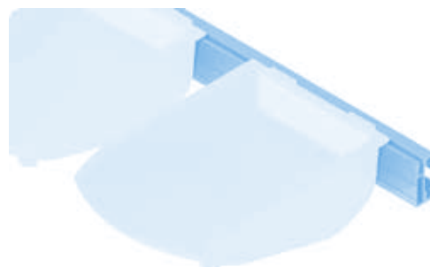
Greifschale 105 × 130 × 50 (Set) Grab Tray 105 × 130 × 50 (Set)