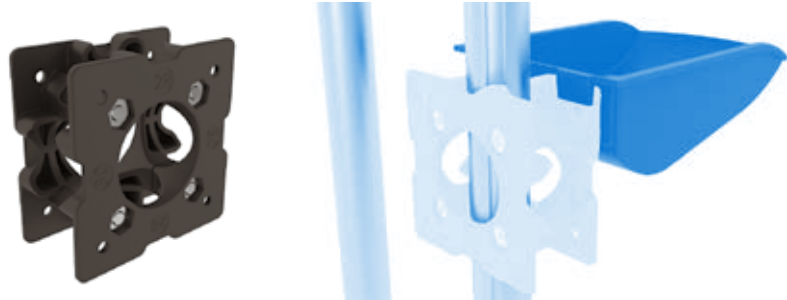
Einhängenplatte D28 / D30 Suspension Plate D28 / D30