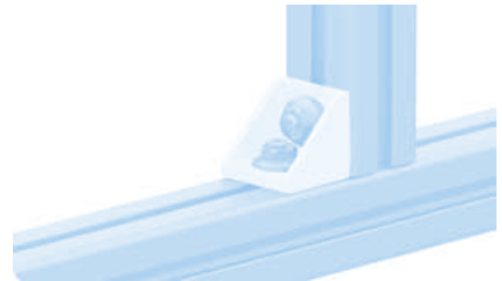
Aluwinkel 45 Alu Connection Angle 45