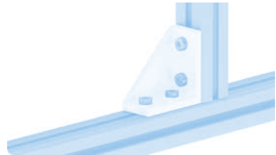
Aluwinkel 30/60 Alu Connection Angle 30/60