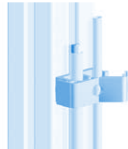
Clip-Kabelbinder Clip Cable Binder