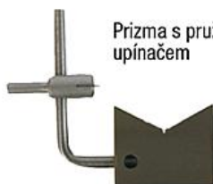
Prizma s pružinovým upínačem