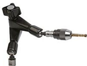
Upínací kloub s malým přesným sklíčidlem