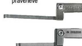
Pružinový upínač pro horizontální sevření pravé/levé