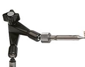
Upínací kloub se sklíčidlem pro malé díly