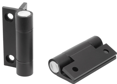
Závěsy s uzavírací pružinou