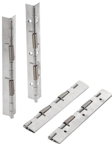
Závěsy s uzavírací pružinou