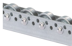
Kolečkové lišty s ocelovými pozinkovanými kolečky Ø 48 mm