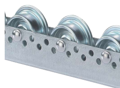
Kolečkové lišty s ocelovými pozinkovanými kolečky s nákolkem Ø 50/66 mm

V objednávce, prosím, uveďte požadovanou délku kolečkové lišty (délka musí být dělitelná 25 mm).