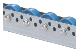
Kolečkové lišty s plastovými kolečky Ø 48 mm