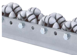
Lišty s všesměrovými kolečky

Rozteč koleček (66, 100, ...) uvedená v katalogu je pouze přibližná. Přesná osová rozteč je 33,33 mm.