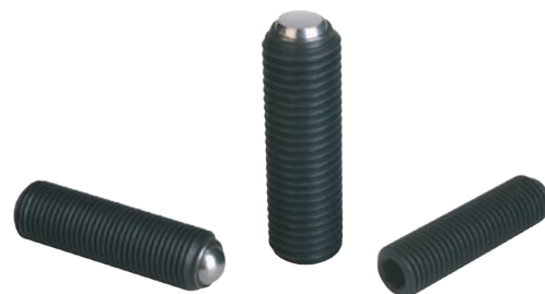
Provedení A s plnou kuličkou