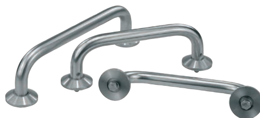
Provedení A k přišroubování na přední stranu