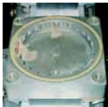
Einsetzbar bei diesen Saugeraufnahmen